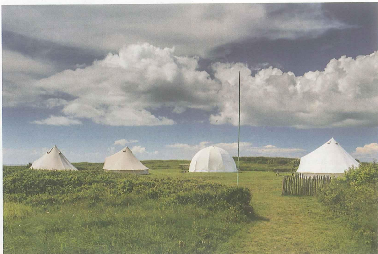
LA BOÎTE À POISSONS, ÎLE DE HOUAT